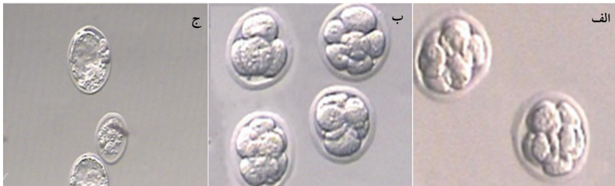
شکل ۱ جنین‌های ۸ سلولی غیر منجمد (الف)، جنین‌های ۸ سلولی بعد از انجماد و گرم کردن (ب) و جنین‌های بلاستوسیست بعد از انجماد مجدد (ج)، بزرگنمایی \times 200

*: تفاوت معنی دار با گروه کنترل وجود دارد ( P < 0/05 )