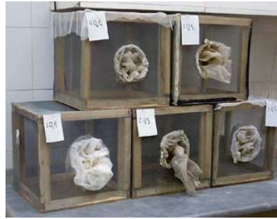
شکل ۱ سمت راست: قفس‌های نگهداری پشه‌های بالغ. سمت چپ: لیوانهای محتوی لارو