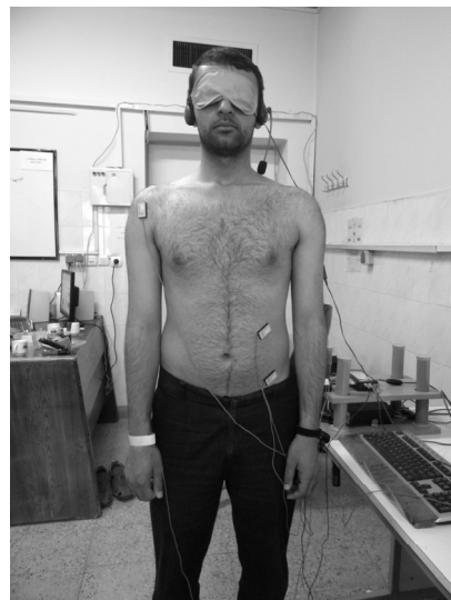
شکل ۱. نمایی از وضعیت ثبت اطلاعات

حداکثر شتاب این حرکت و انحراف معیار آن در هر فرد مشخص شود. این تکرار آزمون‌ها به تعداد حداقل ۲۰ مرتبه (که پیش از شروع ۷۵ ثبت اولیه انجام شد) به دو منظور محاسبه میانگین حداکثر شتاب و از بین بردن اثر یادگیری انجام شد. طی هر مرحله از انجام آزمایش، چنانچه در هر تکراری از وضعیت‌های آزمون، میزان حداکثر شتاب اندام کمتر از ۲ برابر انحراف معیار میانگین شتاب فرد بود، آن تکرار حذف می‌شد. برای جلوگیری از بروز خستگی، هر فرد حداقل پس از انجام ۲۰ تکرار استراحت کرده و در صورت لزوم زمان بیشتری برای استراحت به آن‌ها داده شد. با توجه به یکسان بودن میانگین تغییرات ده تکرار اول از ۷۵ تکرار هر فرد با ده تکرار آخر همان فرد، از عدم اثر پدیده‌های خستگی و یادگیری اطمینان حاصل شد.